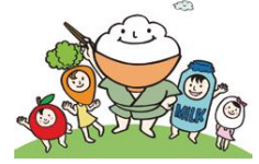
千代田区食育キャラクター