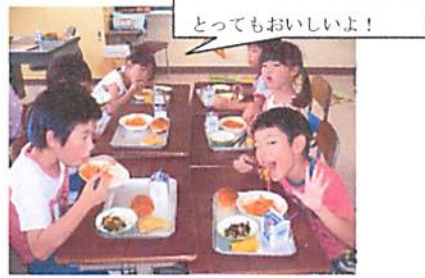
その日の給食（ナポリタン）でいただきました。